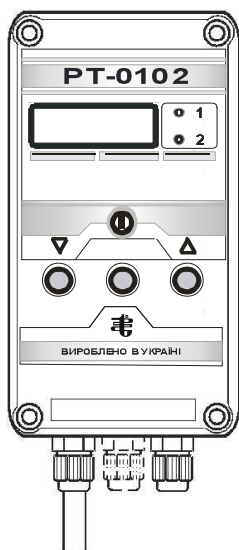
Вигляд спереду, збоку

Увага! Можливі зміни технічних характеристик (діапазон, похибка та ін.)